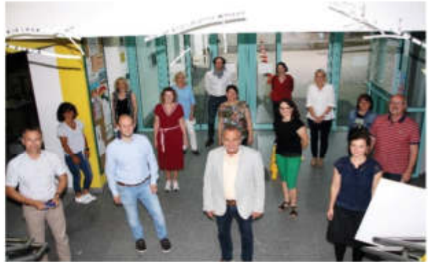
Die Umweltbeauftragten der Schulen wurden in die GMS Eging a. See zu einer Informationsveranstaltung eingeladen.

Unser Klima und unsere Umwelt schützen! – in diesem Kontext ist verantwortungsvolles Handeln wichtiger denn je. Es gibt viele Situationen im alltäglichen Leben, in denen wir klima- und umweltfreundlich agieren können. Themen wie das Einsparen von Energie, unser täglicher Einkauf von Lebensmitteln und unser Mobilitätsverhalten sind hier relevant. Schaffen wir es hier gemeinsam an einem Strang zu ziehen, um uns in die Richtung einer ‚enkeltauglichen‘ Zukunft zu entwickeln?