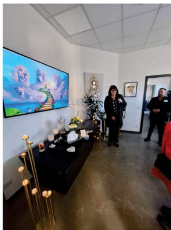
Das Foto zeigt den Abschiedsraum